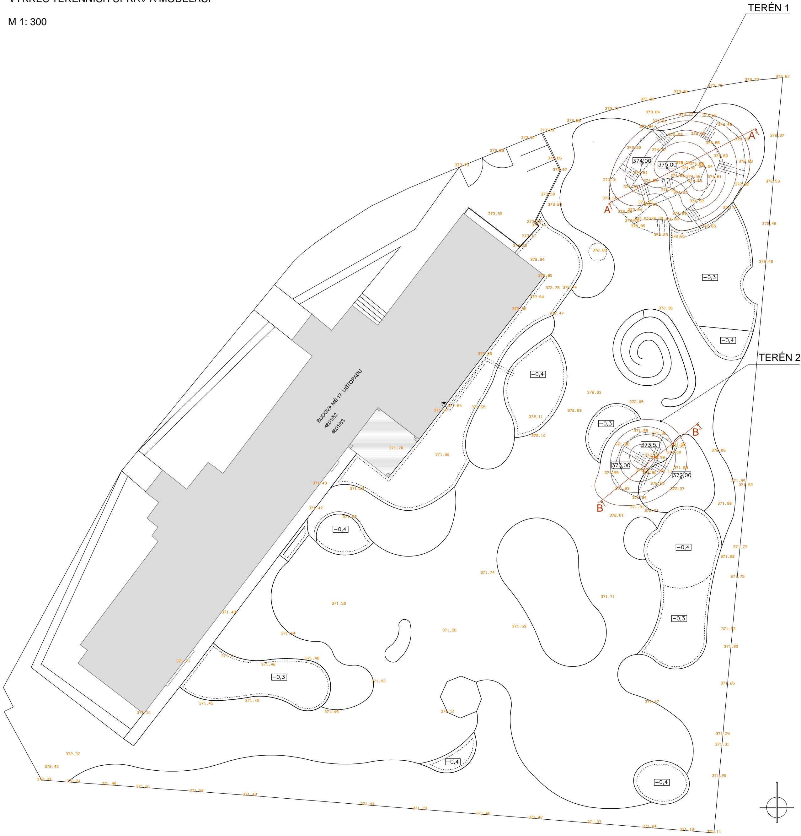
TERÉN 1 ŘEZ A - A'